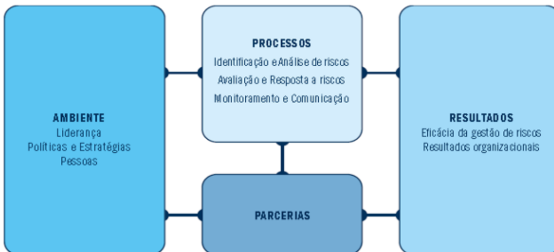
Figura 1: Dimensões para avaliação da maturidade da gestão de riscos