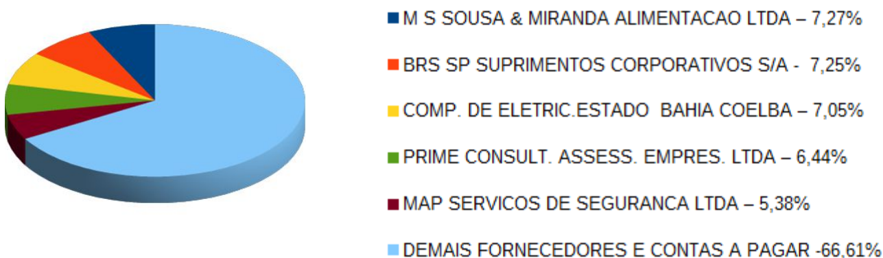
Gráfico: – Composição das obrigações com fornecedores a curto prazo:

O próximo gráfico apresenta a representatividade dos 5 (cinco) maiores fornecedores a curto prazo em relação as obrigações totais do Órgão.