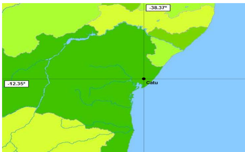
Figura 1 — Localização do Município de Catu (Bahia-Brasil)

O município de Catu localizado no litoral norte e agreste de Alagoinhas do Estado da Bahia (figura 1) possui área de 439,573 km 2 e população de 50.809 habitantes (IBGE, 2015), faz limite com as cidades de Pojuca, Alagoinhas, Araçás, Teodoro Sampaio, Terra Nova e São Sebastião do Passé. É importante destacar a sua proximidade em relação à Salvador – 78 km, Feira de Santana – 110 km, Alagoinhas – 32 km e Camaçari – 40 km (IF BAIANO CAMPUS CATU, PPC QUÍMICA, 2013).