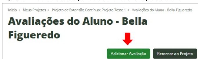
Figura 3 – Tela de acesso para adicionar a avaliação do aluno

IV – Clicar em “Adicionar Avaliação” (Figura 3);