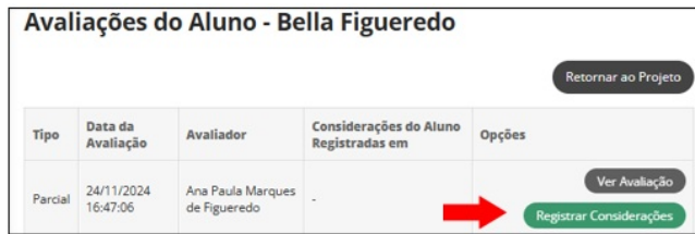
Figura 11 – Tela para acesso ao registro das considerações pelo(a) aluno(a)

V – Clique em “Registrar Considerações” (Figura 11)