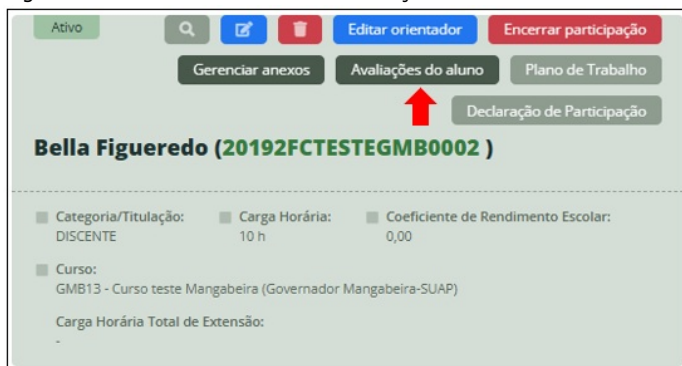
Figura 2 – Tela de acesso à aba “Avaliações do aluno”

III - Localizar o(a) discente a ser avaliado e clicar na aba "Avaliações do aluno" (Figura 2);