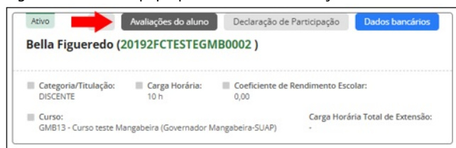
Figura 10 – Tela equipe para acesso à avaliação do aluno

IV – Localizar o nome na equipe e clique na aba "Avaliações do Aluno" (Figura 10)