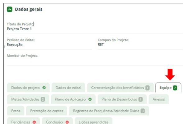
Figura 9 – Tela de acesso à aba "equipe" no projeto de extensão