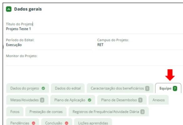
Figura 1 – Tela de acesso à aba “Equipe” no projeto de extensão