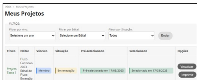
Figura 8 – Tela "Meus Projetos" para selecionar o projeto de extensão do qual o(a) Discente Extensionista participa

II – Selecionar o projeto de extensão do qual participa (Figura 8);